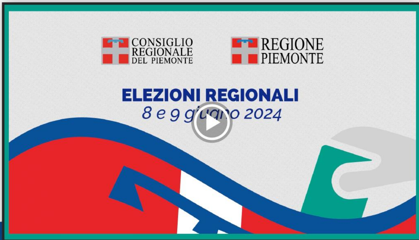
SPECIALE ELEZIONI VIDEOGRAFICA