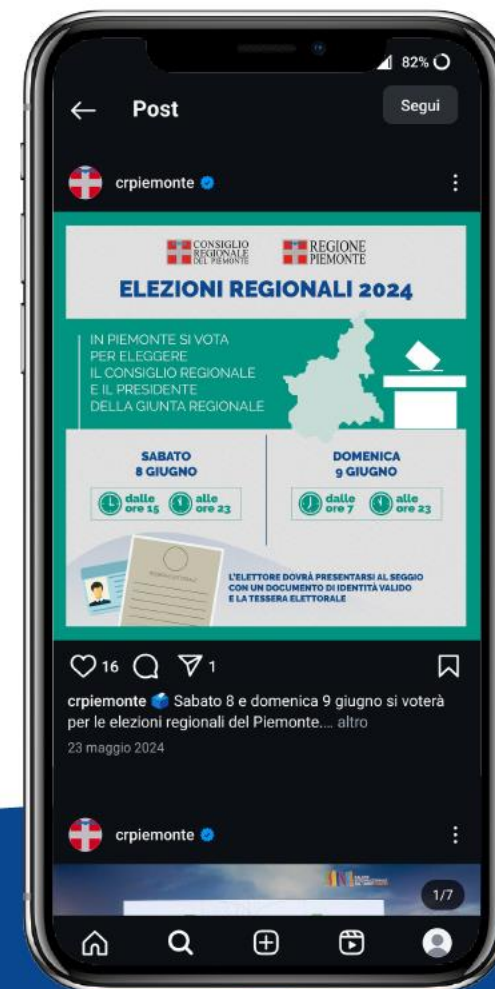
SPECIALE ELEZIONI SOCIAL