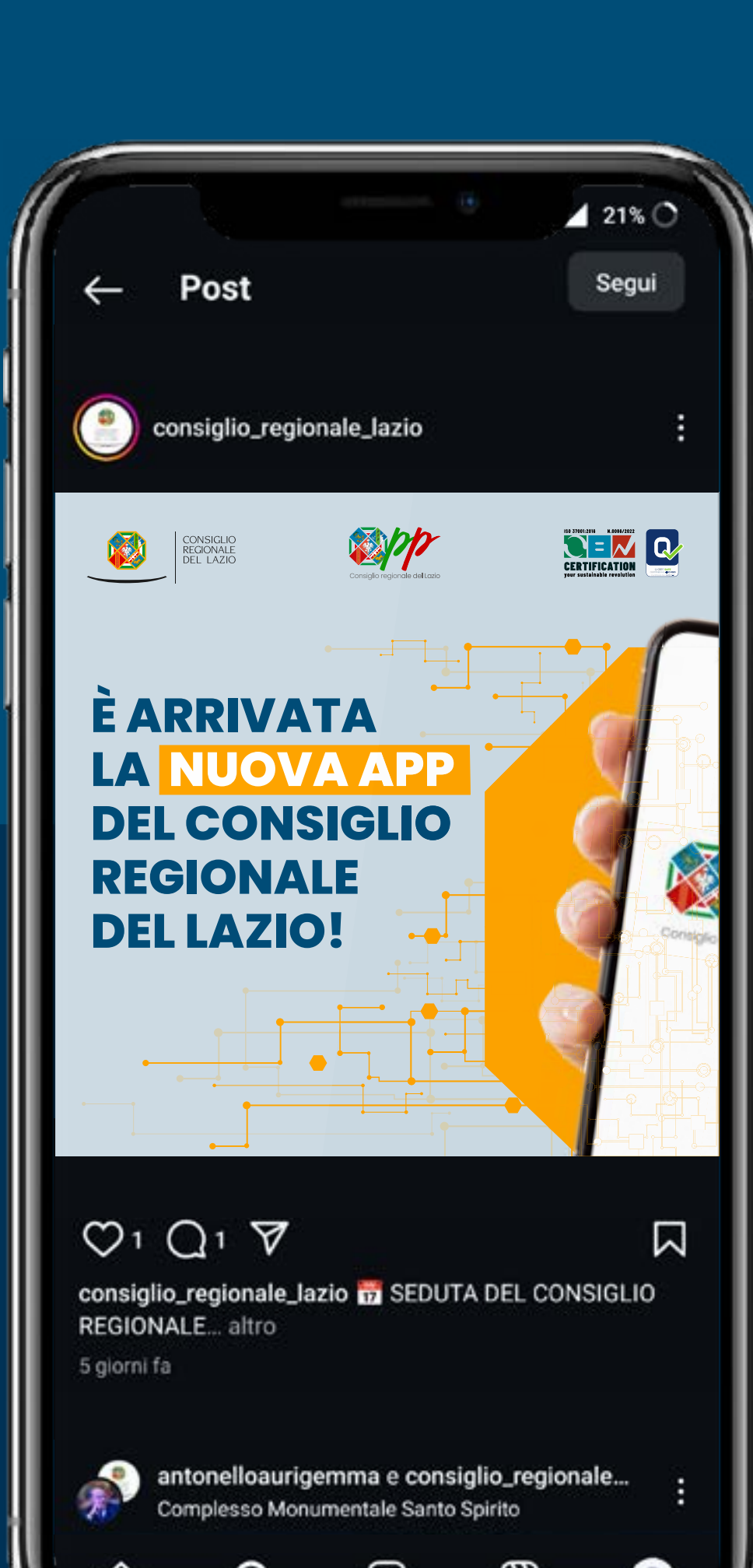
APP CONSIGLIO REGIONALE DEL LAZIO CAROSELLO SOCIAL