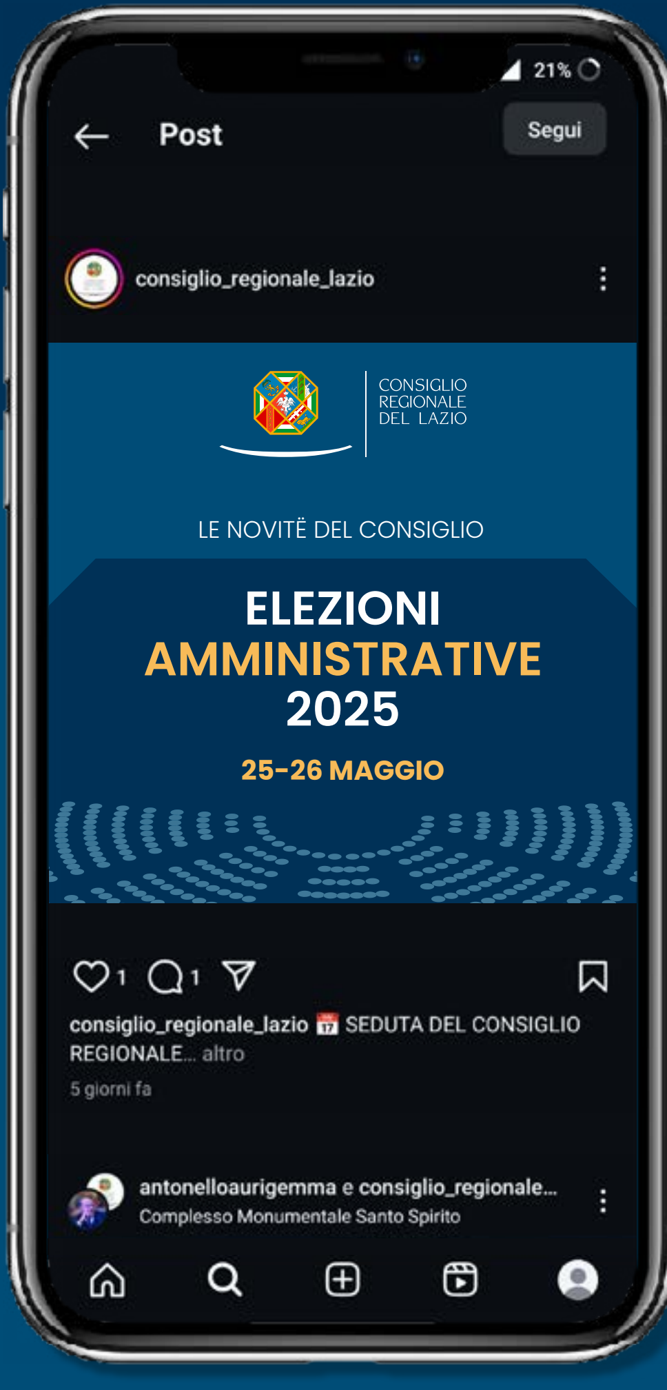
ELEZIONI AMMINISTRATIVE CAROSELLO SOCIAL